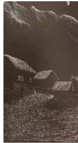
Illustrasjon fra boka